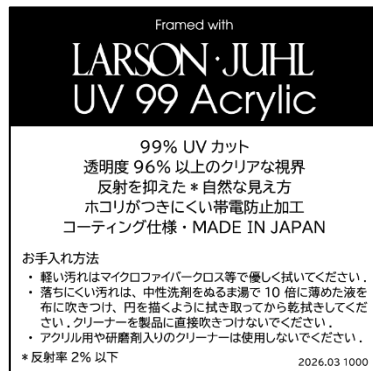
ラーソン・ジュール UV99