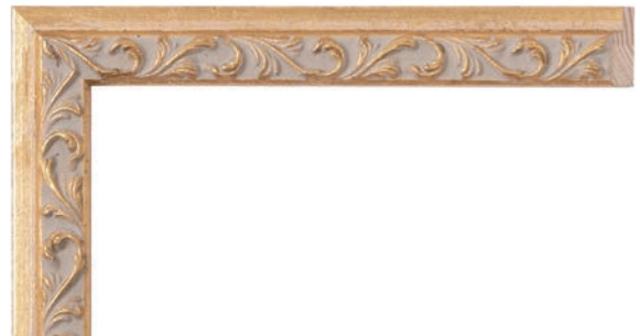
Y - 131716 金