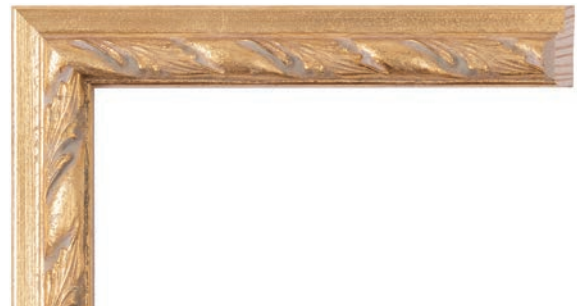
Y - 146001 金